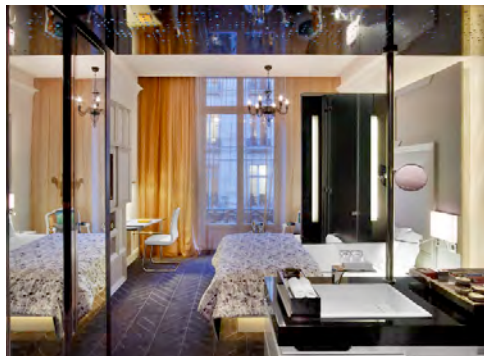
Hôtel W Opéra – Paris 9 e arrondissement (design e ristorazione)