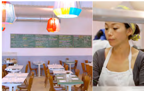
Nanashi – Paris 10 e arrondissement (cantina franco-giapponese)