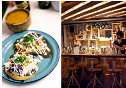
Candalaria – Paris 3 e arrondissement (concept)