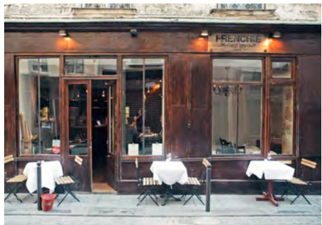
Frenchie bar à vin – Paris 2 e arrondissement (concept)